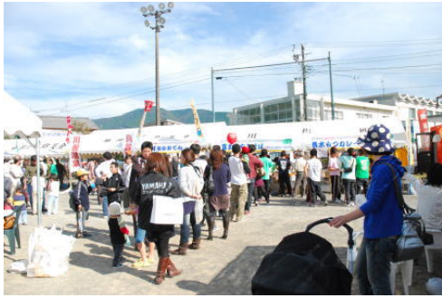
※写真は昨年の様子