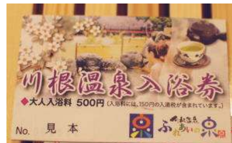
川根温泉入浴券 1枚 500円

1枚単位でご購入ができる贈答用温泉入浴券ができました。「必要な枚数分だけ贈りたい」「贈答にふさわしい入浴券が欲しい」そんな意見にお応えいたしました。（10枚以上のご購入でしたら11枚綴りの回数券がお得です。）今なら3枚以上お買い上げいただくと、川根温泉入浴剤1回分をプレゼント中。