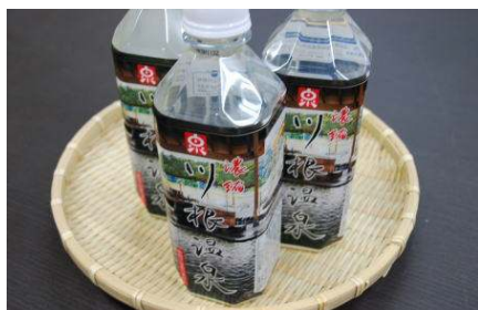
濃縮川根温泉 500ml 525円

ご好評いただいております、源泉を20倍に濃縮した『濃縮川根温泉』に6本入り化粧箱ができました。今なら5本分のお値段、2625円で1本おまけ付。川根温泉本館売店、道の駅外売店で販売中です。従来どおり12本入、24本入もごぞいます。