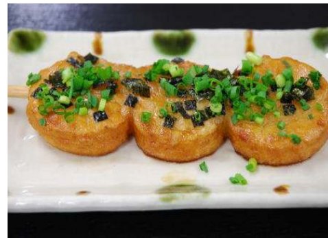
いももち 一串 200円

《いももち》 餅のようなポテトのような不思議な食感で新登場。色よく揚げ、青ネギ・もみのりをトッピングしました。本館お食事処でも好評発売中です。