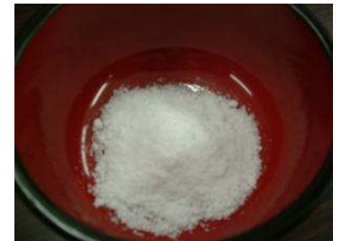
④完全に水分が蒸発し、粉末状になれば完成。