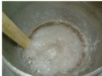
②沸騰し、釜の縁に塩ができはじめる。