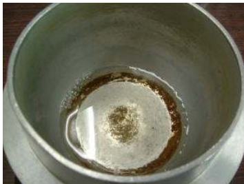
①釜に濃縮温泉100ccを入れる。

濃縮川根温泉1リットルから約100gの塩ができます。(写真は塩作り体験で約10gの塩を作る方法)