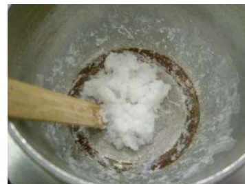
③水分が蒸発し、シャベット状になります。