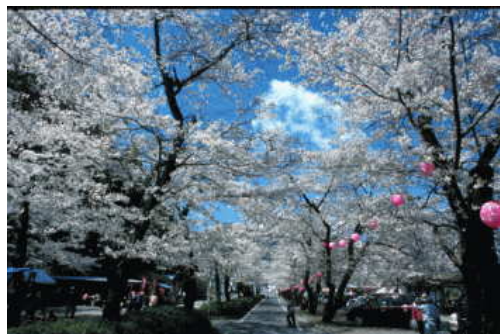
家山の桜トンネル

今年も、3月28日(日)に牛代のみずめ桜や家山の桜トンネルを見る巨樹巡りを開催します。樹齢300年のみずめ桜は平成19年に川根町の天然記念物に指定されています。