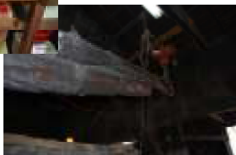
醤油を絞る大きな棒