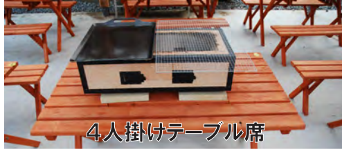
4人掛けテーブル席